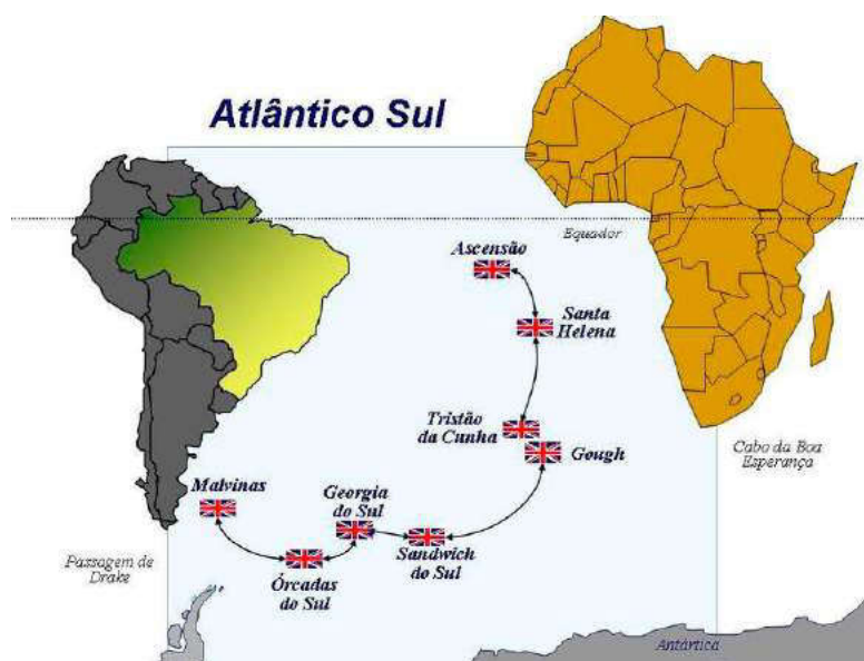
Figura 3: Mapa referente aos territórios ultramarinos britânicos, localizados no Atlântico Sul

deles nucleares, além de conter cinco destróieres, treze fragatas, 22 navios de patrulha e defesa costeira, 41 navios anfíbios, 16 navios destinados a guerra de minas e 10 navios para logística e suporte. Somado a isso, apresenta também dois porta-aviões, que estão em fase de construção e devem ser comissionados a partir de 2017, o que tende a exacerbar a presença britânica na bacia sul atlântica. O Reino Unido possui também forças, atuando no Atlântico Sul, especialmente nas ilhas Malvinas, onde há cerca de 1500 soldados permanentes, um navio patrulha, um navio escolta e eventualmente um submarino em Ascensão e Serra Leoa. Além disso, há também um destróier em estado de patrulha permanente no Atlântico Sul (GOMES GUIMARÃES, 2015).