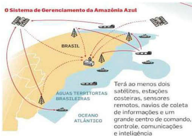
Figura 03: O Sistema de Gerenciamento da Amazônia Azul

Os possíveis benefícios desse sistema seriam advindos do fato de ele empregar civis e militares, além de ser útil no combate às novas ameaças, tal qual o tráfico ilegal de entorpecentes, e na própria possibilidade de operação com outros sistemas, como o Sistema de Vigilância de Fronteiras (Sisfron) e o Sistema de Defesa Aérea Brasileira (SDAB) (BRASIL, 2013). No infográfico abaixo, é possível compreender a sistematização e o funcionamento integrado do SisGAAz: