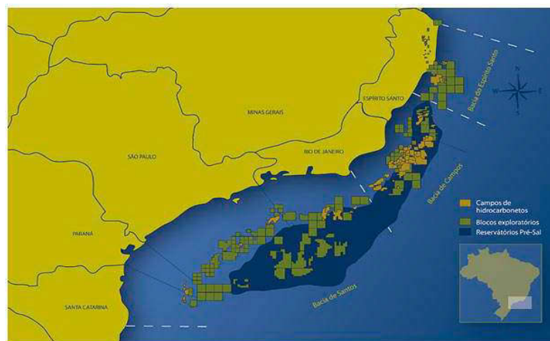
Figura 02: Província Petrolífera do Pré-Sal

Um importante acontecimento – que teve grande impacto na inflexão dos rumos do desenvolvimento em direção ao Atlântico Sul – foi a descoberta das novas jazidas na Bacia de Campos e, principalmente, os promissores campos nas águas profundas da Bacia de Santos (o Pré-sal). Com isso, o país tornou-se autossuficiente em petróleo, no início dos anos 2000, e hoje quase 90% da produção provém da exploração offshore . Estudos de potencialidade indicam que, após a entrada em operação dos campos do Pré-sal, haverá condições de produzir excedentes e o país poderá tornar-se importante exportador de petróleo, de gás natural e dos seus derivados (COSTA, 2012).